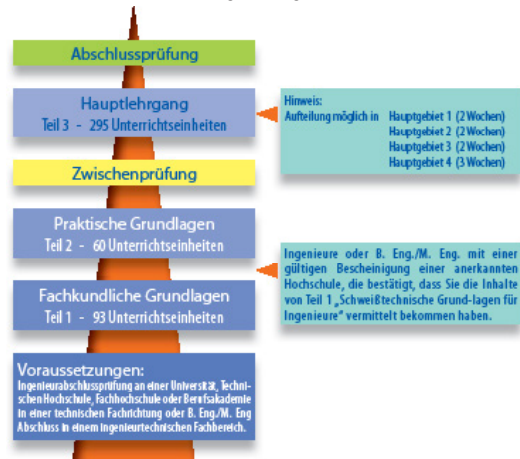
Der Schweißfachingenieur-Lehrgang erfolgt nach der Richtlinie DVS-IIW 1170

In Mittel- und Großbetrieben werden Schweißfachingenieure in den verschiedenen Betriebsabteilungen eingesetzt, um dort das Einhalten schweißtechnischer Arbeitsregeln zu gewährleisten.