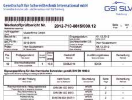
Ausschnitt aus einem Musterprüfbericht.

Der erfolgreiche Nachweis der geforderten Eigenschaften stellt die Grundlage für den Bericht über die Qualifizierung des thermischen