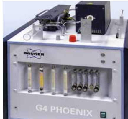
Modernes Wasserstoffanalysegerät Phoenix G4 der Firma Bruker zur Bestimmung von diffusiblem Wasserstoff in Schweißproben nach DIN EN ISO 3690.

Um für diese analytischen Herausforderungen der Wasserstoffbestimmung gewappnet zu sein, wurde deshalb das Wasserstofflabor der GSI mbH, Niederlassung SLV Duisburg, mit der modernen Wasserstoffanalyseeinheit Phoenix G4 der Firma Bruker modernisiert. Das Gerät verfügt über zwei Ofeneinheiten sowie eine Yanakoo-Einheit. Diese Kombination